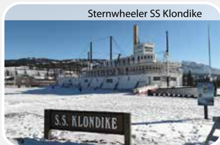
Sternwheeler SS Klondike